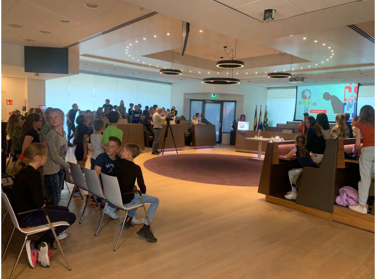
Vrijheidscollege Dieuwertje Blok in Harderwijk/april 2022