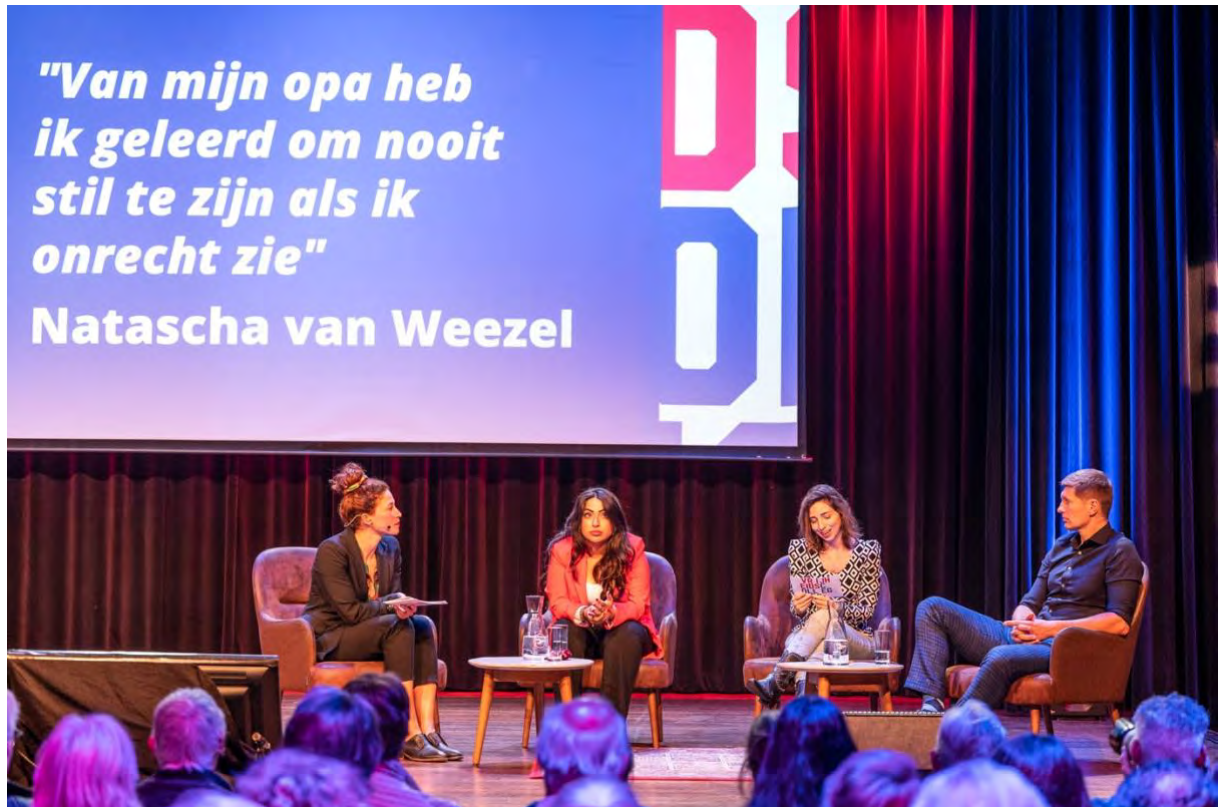
Vrijheidscolleges Live in Tivoli Vredenburg – 5 mei 2022