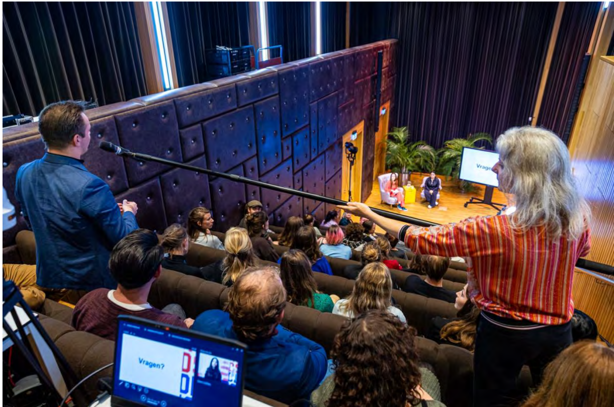
Lale Gül geeft Vrijheidscollege in bibliotheek de Rozet in Arnhem / 7 april 2022