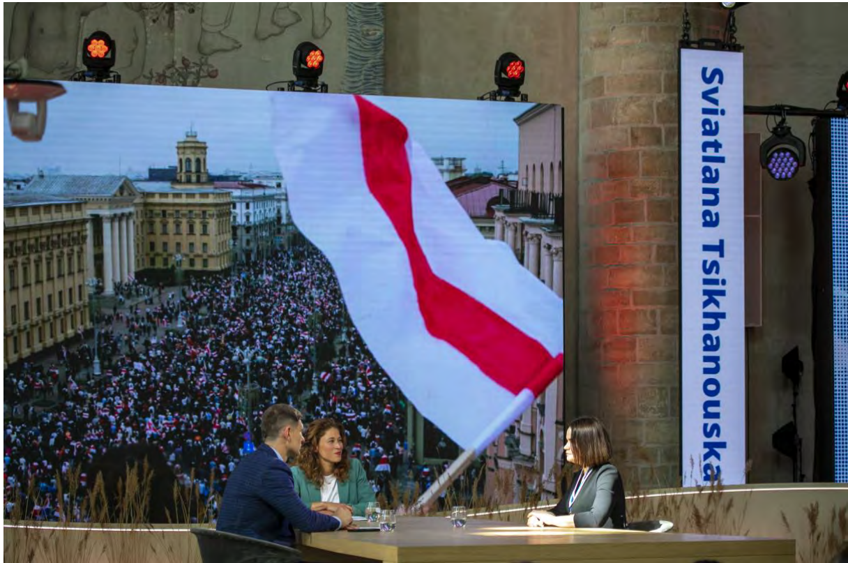
Meet Up: Svetlana Tichanovskaja en Evgeniy Levchenko in gesprek met Amber Kortzorg/ 21 april 2022